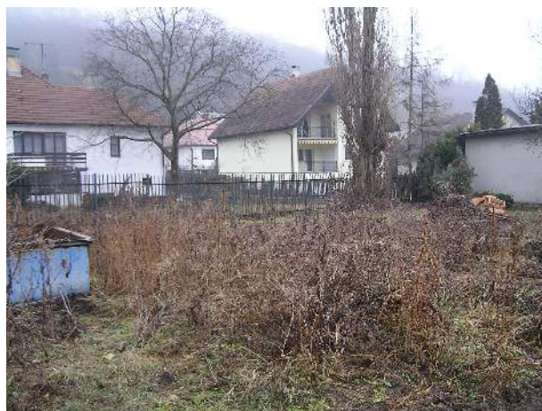
Obr. č. 2: