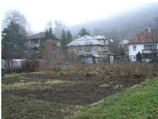
Obr. č. 3: