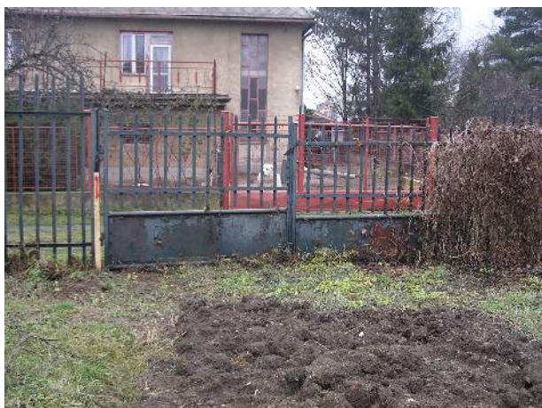
Obr. č. 1: