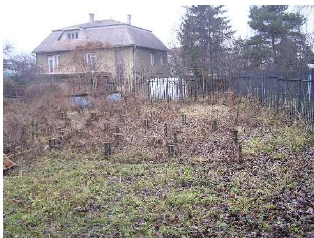
Obr. č. 5: