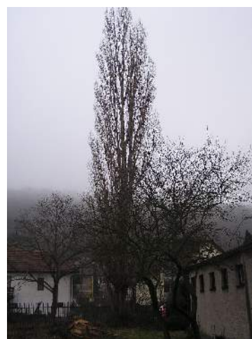
Obr. č. 6: